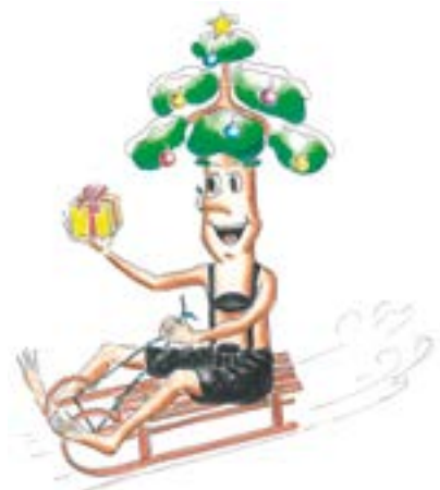
Christian Hornsteiner Erster Bürgermeister