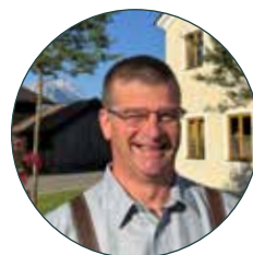
Christian Hornsteiner Erster Bürgermeister