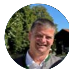
Christian Hornsteiner Erster Bürgermeister